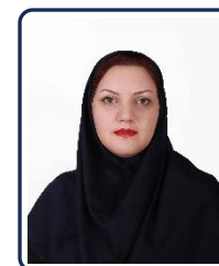
مریم شریعت‌زاده (نویسنده مسئول)

تاب‌آوری کشاورزی، یادگیری مشارکتی، تحول دیجیتال، بهره‌وری آب، زنجیره ارزش، مشاوره داده‌محور